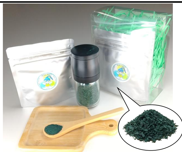
■アスモシリーズ 第2弾 アスモ(粗びきスピルリナ)ミル付