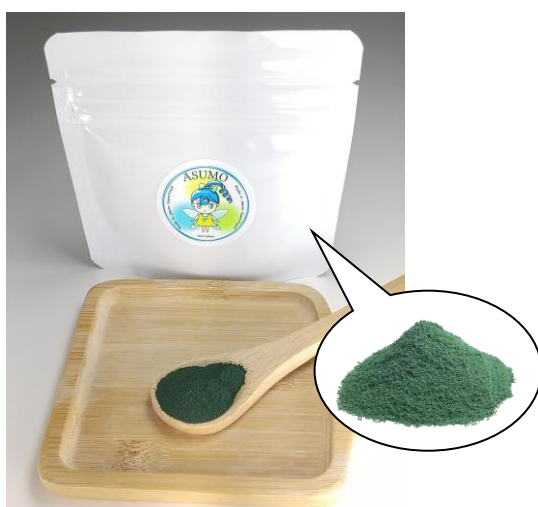
■アスモシリーズ 第1弾 アスモ(スピルリナ粉末)