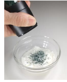
前菜:アスモ×ドレッシング×野菜