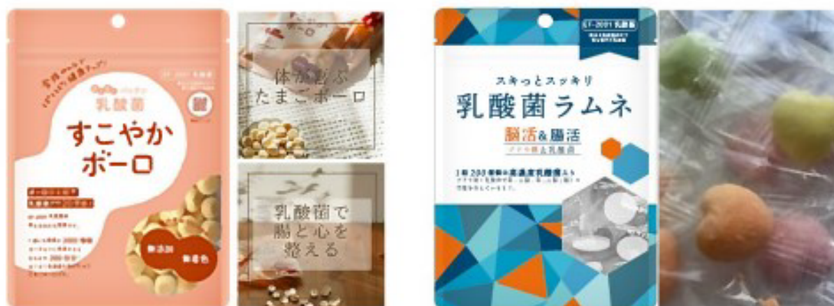
【おとなの乳酸菌シリーズ】