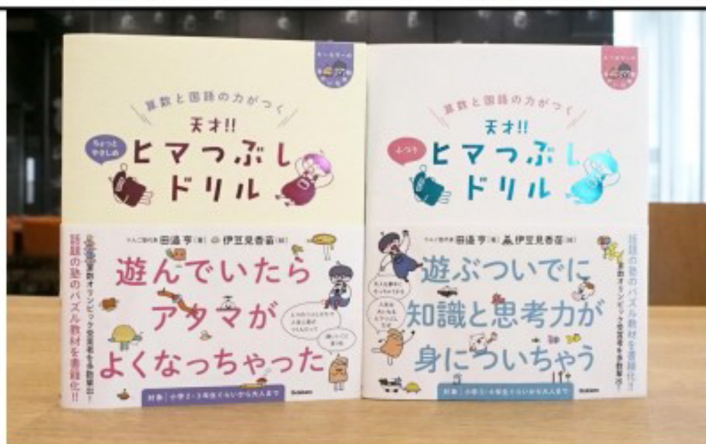
■天才！！ヒマつぶしドリル(ふつう)