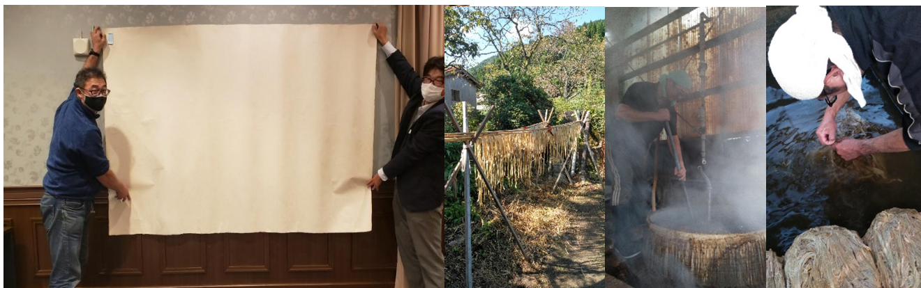
■「因州手すき大判和紙 5×7判」