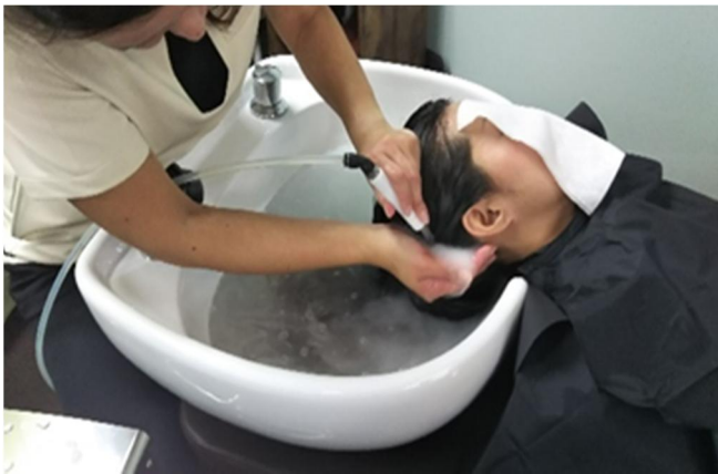
■白いマイクロバブルで洗浄