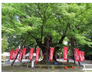
<今宮神社の御神木>