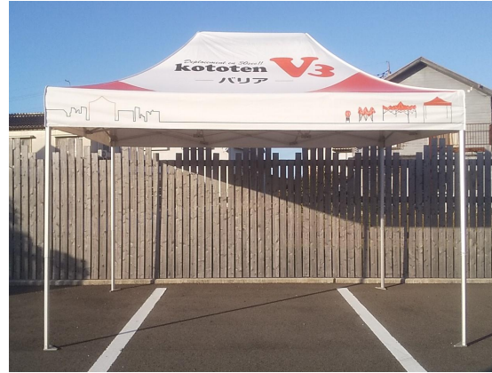
＜プリントしたテント＞