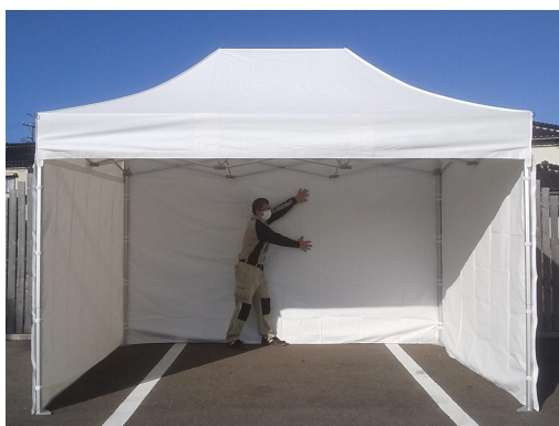
■コテンV3 バリア(設置状態)