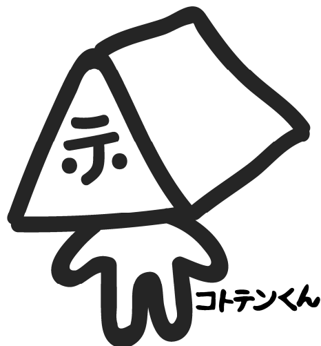
■コテンくん（寿テントオリジナルキャラクター）

人手不足が深刻化する中、弊社においても同様の状態。少人数でも設置でき、メンテナンスが簡単な製品を探しておりました。国内外で調査した結果、2014年フランス・VITABRI（ビタブリ）社のポップアップテントV3に出会い、何度か足を運びフレームは輸入、天幕は自社製造できる契約になりました。試行錯誤しながら商品化を進め一旦は全国販売しましたが、安価な商品が一般的になっている現在、価格競争についていけません。ここにきてコロナが蔓延し販売・レンタルも足踏み状態。コロナ後を見据えて現状を打破するため、他社にない優れた商品を新発売。密閉、密集、密接の3密を避けるため、間にバリアを張って安心安全な会場づくりが出来るよう全国に向けて広く販売していきたい。