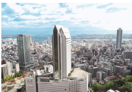
■ANA クラウンプラザホテル神戸